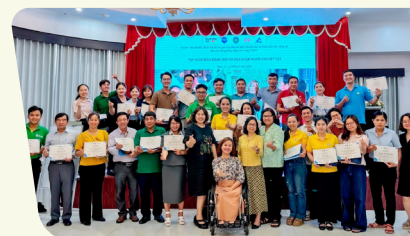
Đào tạo về lồng ghép và thực hành GEDSI cho các doanh nghiệp và cán bộ triển khai Đề án Một triệu héc-ta.

Một điểm nhấn trong Năm 2 là đề xuất của Bộ NN&MT đối với Dự án TRVC về việc triển khai chương trình đào tạo cán bộ nguồn (ToT) về GEDSI cho các bên liên quan trong Đề án Một triệu hecta. Khóa đào tạo đầu tiên được tổ chức vào tháng 12/2025 với 28 học viên, bao gồm cán bộ khuyến nông, cán bộ đến từ Sở NN&MT và đại diện Hội LHPN.