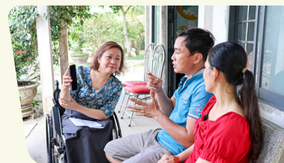
Trao đổi với nông dân khuyết tật nhằm ghi nhận bài học thực tiễn để tăng cường thực hành GEDSI.